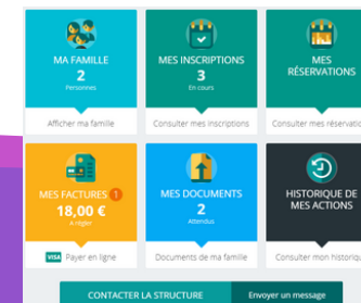
Tableau de bord Page d'accueil de l'espace familles une fois la connexion effectuée Les boutons permettent d'accéder au contenu du menu.

Le portail famille a pour but de vous faire gagner du temps en simplifiant les démarches, d'éviter de vous déplacer et de maîtriser l'inscription de vos enfants.